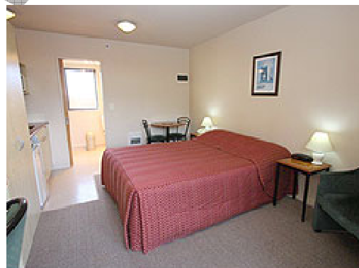
Standard Unit + Family Unit

Motel Units sind als Studio, aber auch mit ein-, zwei- oder gar drei separaten Schlafzimmern zu bekommen.