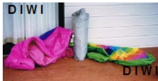
Zelten bei minus 6 Grad - Zeltausrüstung

Oftmals sind die Campingplätze mit wetterfesten Camp Küchen und Aufenthaltsräumen ausgestattet. BBQ, Swimmingpool, Shop sowie diverse Freizeitmöglichkeiten bieten viele Camps an.