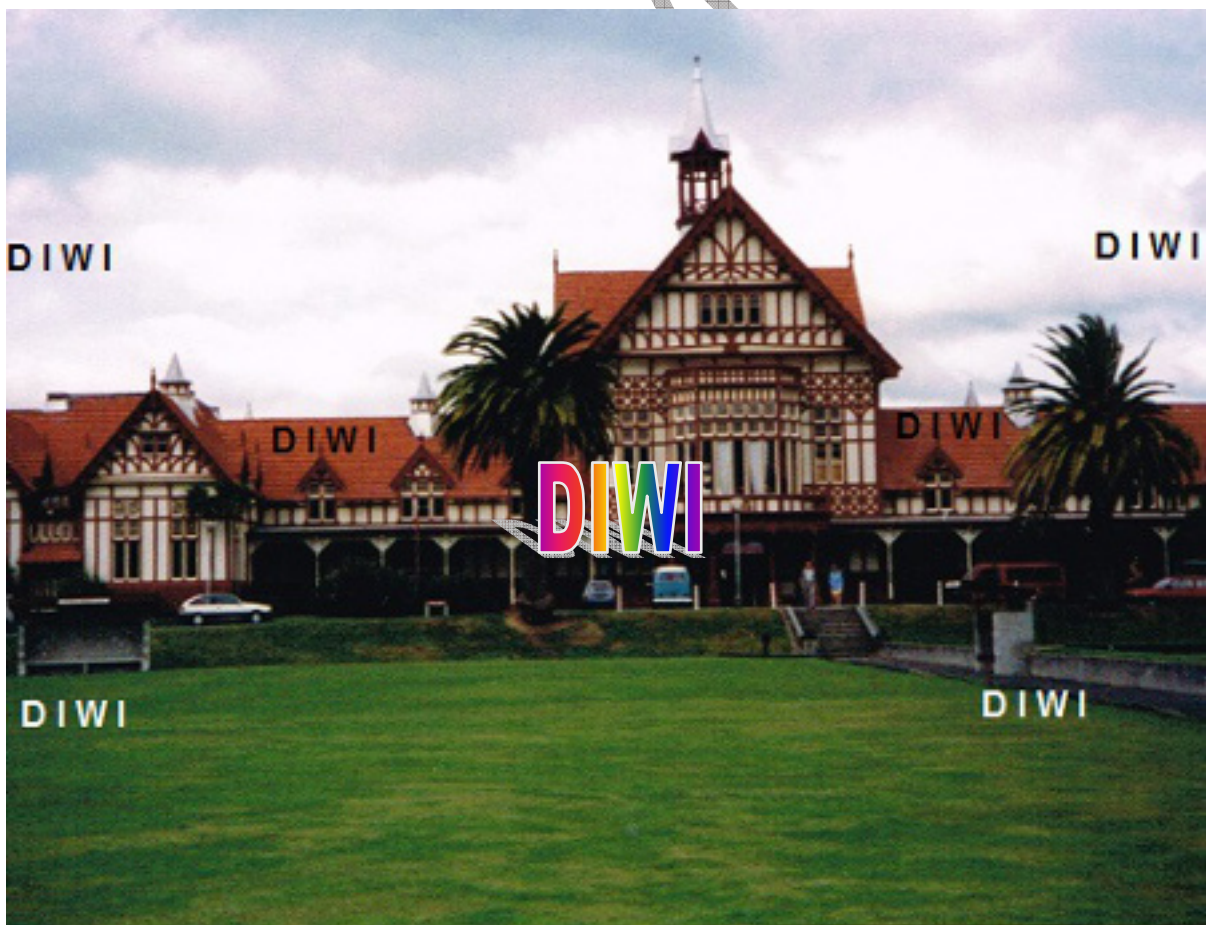
Rotorua Museum